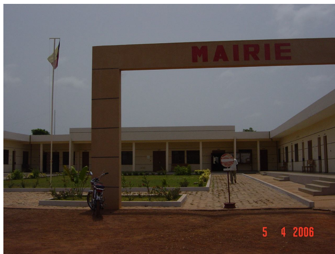
La Mairie de N'Dali

La commune de N'Dali regroupe 24 villages ou quartiers de ville et cinq (5) arrondissements que sont : N'Dali (06 quartiers), Sirarou (03 villages), Bori (05 villages), Gbégourou (05 villages) et Ouénou (05 villages).