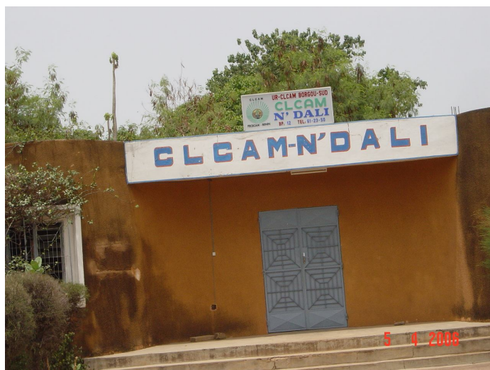
La CLCAM, une institution importante de mobilisation de l'épargne locale dans la commune de N'Dali

Les activités économiques de la commune de N'Dali se fondent notamment sur le secteur primaire et le développement de petites unités de production. Les activités économiques dominantes sont l'agriculture (74,2%) et le commerce et la restauration (18,9%).